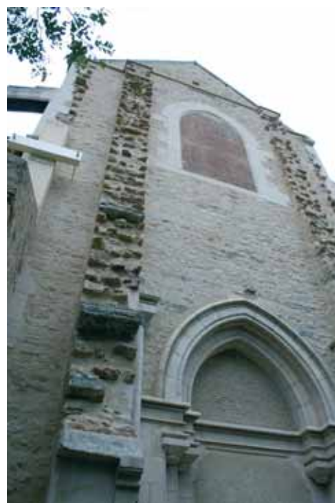
Façade sud inachevée