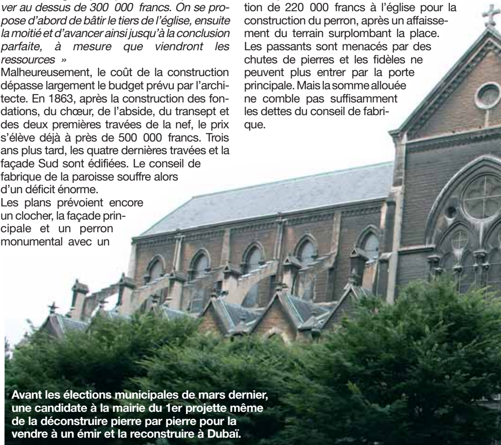
Avant les élections municipales de mars dernier, une candidate à la mairie du 1er projette même de la déconstruire pierre par pierre pour la vendre à un émir et la reconstruire à Dubaï.

Un an plus tard, la ville accorde une subvention de 220 000 francs à l'église pour la construction du perron, après un affaissement du terrain surplombant la place. Les passants sont menacés par des chutes de pierres et les fidèles ne peuvent plus entrer par la porte principale. Mais la somme allouée ne comble pas suffisamment les dettes du conseil de fabrique.